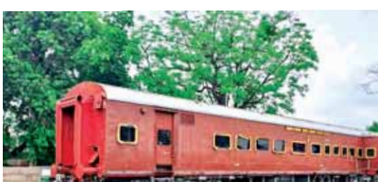
भोपाल स्टेशन के प्लेटफॉर्म नंबर 6 की ओर पड़ा टूटा-फूटा कोच।