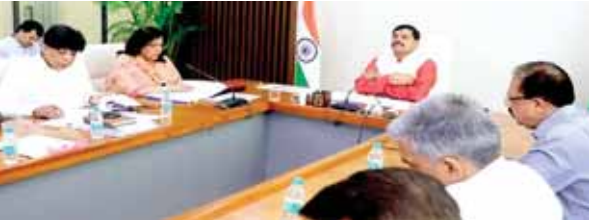
हरिभूमि न्यूज़ ►► भोपाल

मुख्यमंत्री ने वीडियो कॉन्फ्रेंस से दिए जिला और संभागीय अधिकारियों को निर्देश