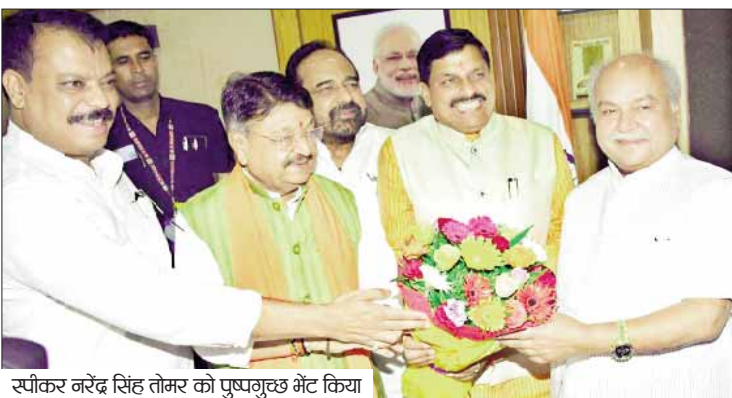
स्पीकर नरेंद्र सिंह तोमर को पुष्पगुच्छ भेंट किया

कांग्रेस के विरोध की वजह से सदन की कार्यवाही एक घंटे के लिए स्थगित करनी पड़ी। स्पीकर के चर्चा कराने के आश्वासन के बाद हंगामा शांत हुआ।