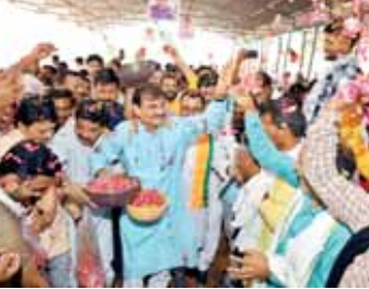
हरिभूमि न्यूज़ ►► भोपाल

भाजपा के प्रदेश अध्यक्ष व खजुराहो सांसद विष्णुदत्त शर्मा ने रविवार को खजुराहो लोकसभा के गुनौर और पर्वई विधानसभा के मतदाता और