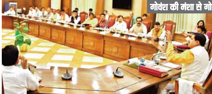
गोवंध की मंशा से गोवंध का परिवहन करने वाले वाहन होंगे राजसात

कैबिनेट बैठक विधानसभा परिसर में हुई, इसमें 10 से अधिक मसौदों को मंजूरी दी गई