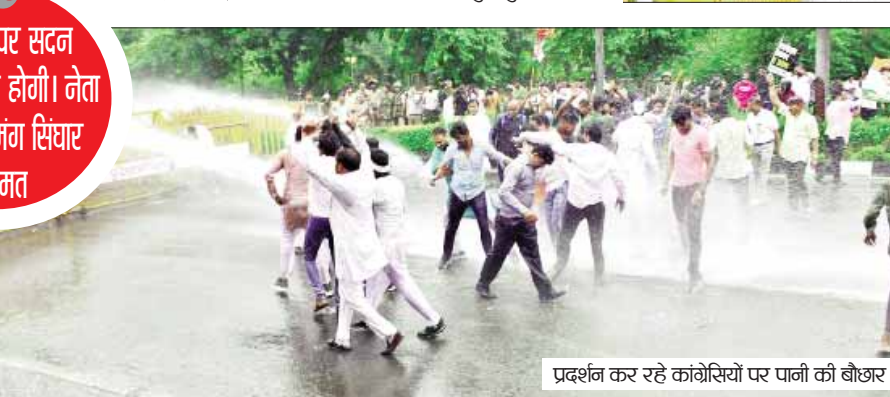
प्रदर्शन कर रहे कांग्रेसियों पर पानी की बौछार